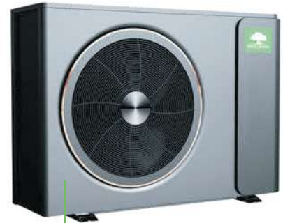
Вигляд зовнішнього блоку